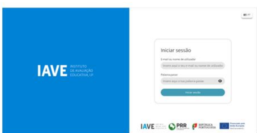
Figura 1 – Acesso à Plataforma de Realização de Provas do IAVE