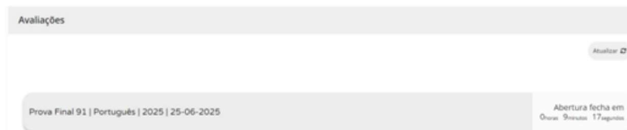
Figura 2 – Acesso à prova a realizar

11.11. Nas provas, ao clicar em “Iniciar sessão”, por exemplo, para um aluno que realiza a prova final de Português (91), aparece o seguinte ecrã: