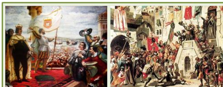
A 1 de Dezembro comemora-se o dia da Restauração da Independência de Portugal, do domínio Filipino, que vigorou no nosso país de 1578 a 1640.

*variedade sujeita a alteração, em função da disponibilidade do mercado abastecedor